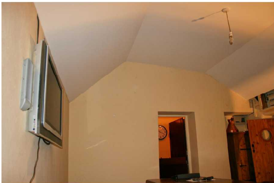
Íbúðarhús, Co. Waterford.

Enso ehf. Faxafen 10, 108 Reykjavík. Sími: 517-3800 Fax: 589-9985