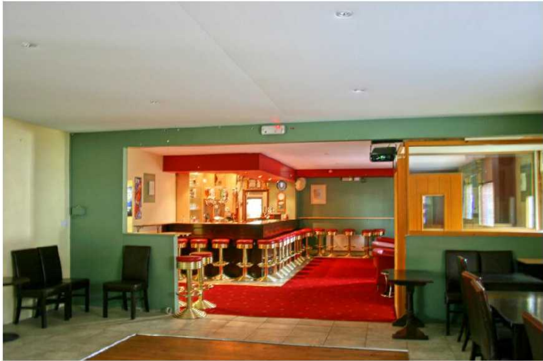
Richie's Pub, Co. Offaly.